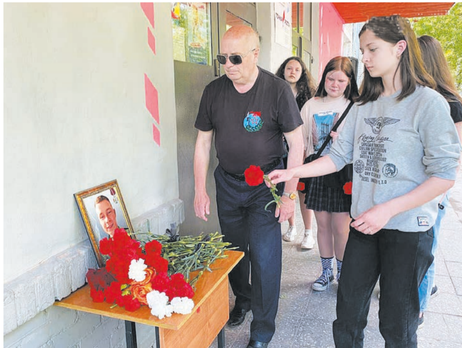
На крыльце 4-й школы. Мемориальные доски